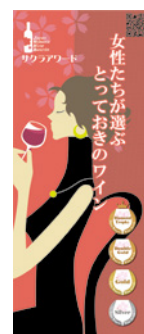
ロールアップ パナー (レンタル)